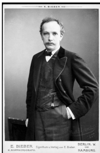
Richard Strauss im Jahr der Uraufführung der französischen „Salomé“, 1907.

Bis heute hat es die französische „Salomé“ von Strauss nicht auf die große Bühne in Paris geschafft. Diese Version hatte auch aus anderen Gründen nur wenig Chancen in der Stadt an der Seine, denn die Pariser Kulturgrößen, darunter Astruc und Rolland, standen dem „Urtext“ des Theaterstücks eher reserviert gegenüber. Sie monierten das schlechte Französisch des Iren und dessen zahlreiche Anglizismen im Text. Rolland formulierte es gegenüber Strauss so: „So bemerkenswert die Französischkenntnisse Wildes auch sein mögen, kann man ihn doch nicht als einen französischen Dichter betrachten.“ Aber auch Strauss' Einrichtung wurde kritisiert. Der Direktor der großen Oper, Gailhard, sagte Strauss offenbar recht direkt, die „Bearbeitung des französischen Textes sei dem französischen Sprachgebrauch zuwiderlaufend und