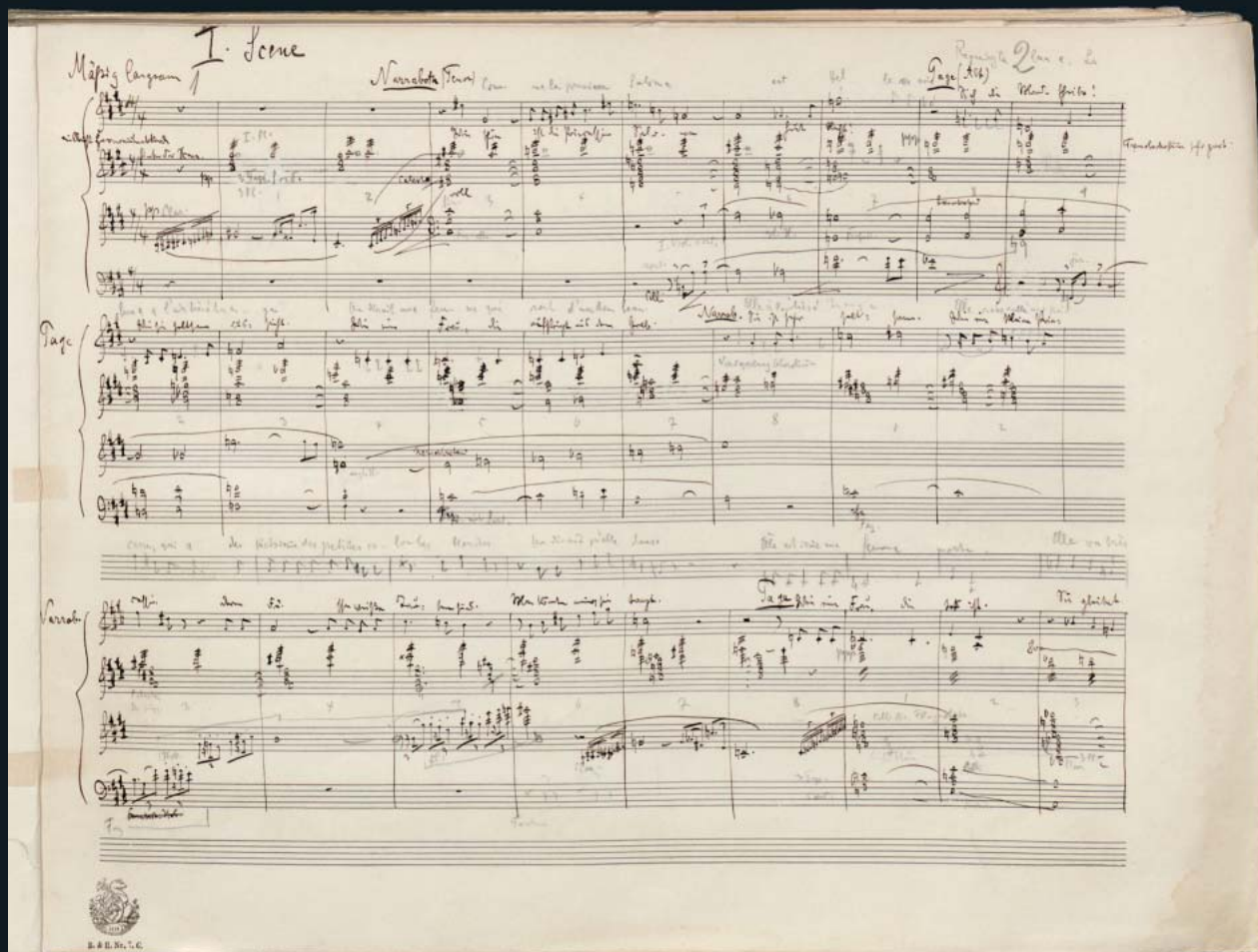
Eigenhändiger Kompositionsentwurf von Richard Strauss für die „Salomé“ (S. 1). Mit Tinte schrieb er die deutsche Fassung, mit Bleistift skizzierte er die Einrichtung der „Französischen Fassung“. Bei manchen Stellen war er sich nicht sicher und notierte sich am Rand Fragen zur Vertonung.