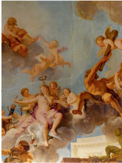
S. 54 | Start eines deutsch-französischen Projekts über barocke Deckenmalerei.

Zur Bedeutung von Sicherheit und Freiheit für ältere Menschen