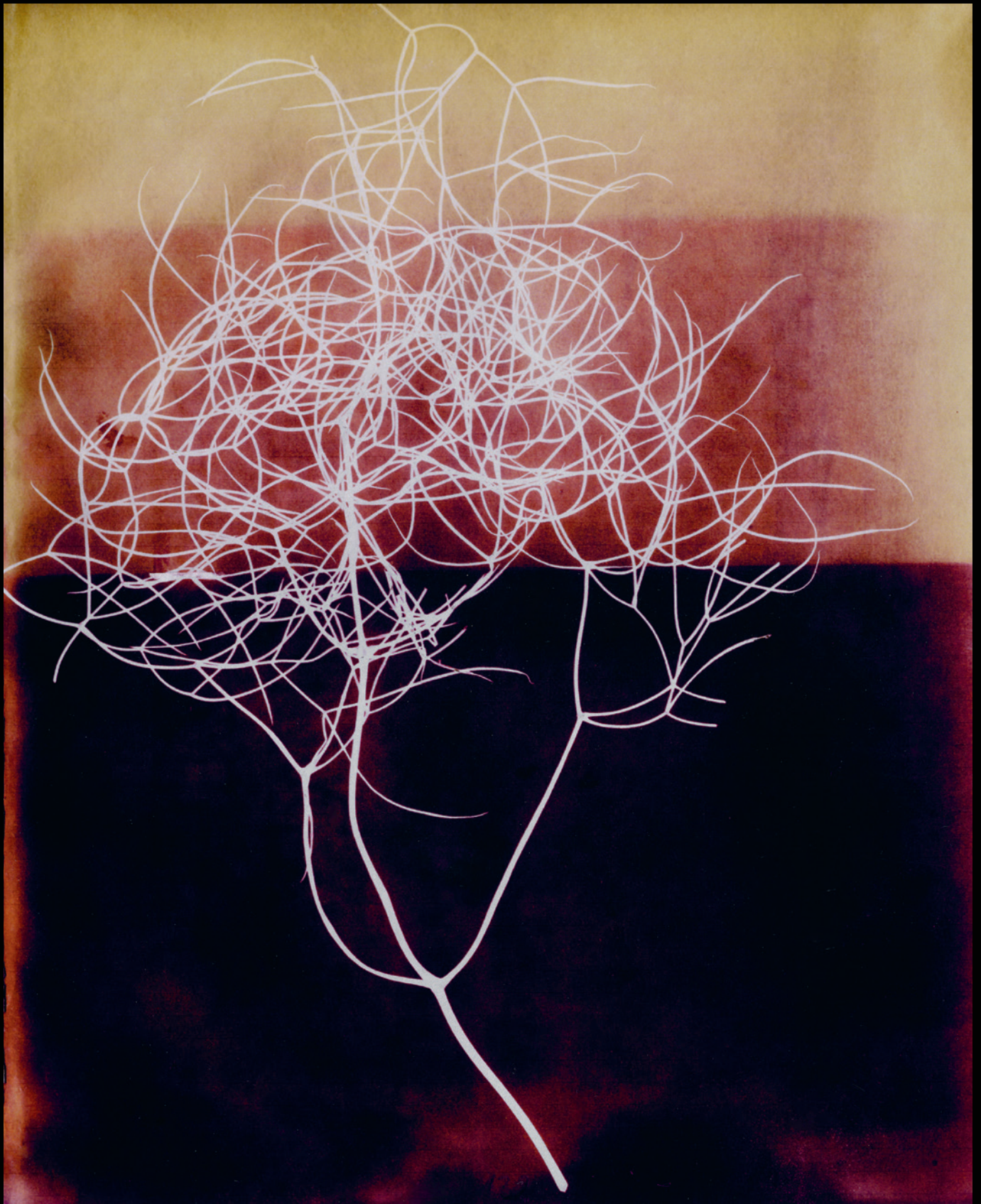
Probe aus der Botanik: wilder Fenchel oder Dill (Kontakt auf Papiernegativ).