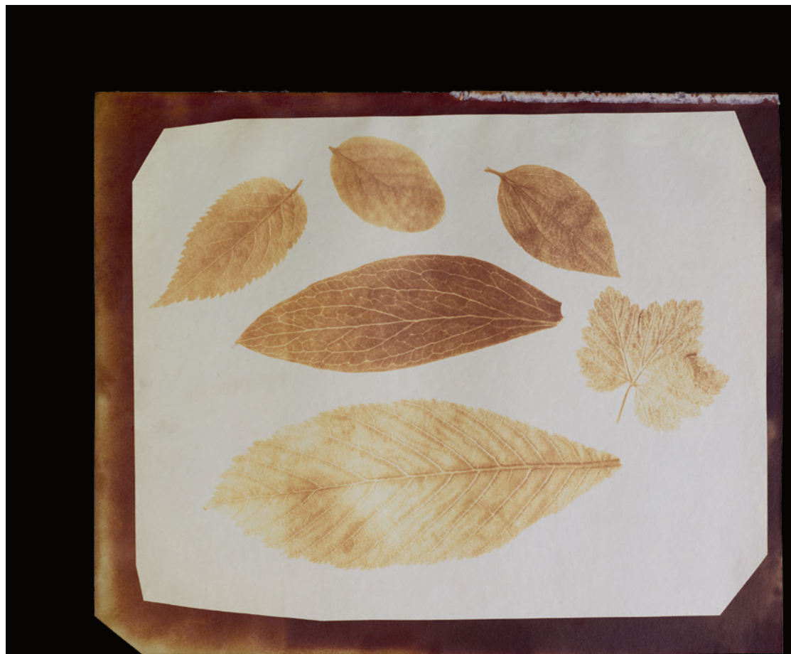
Oben: Korbmacher vor einer offenen Hütte, davor Körbe, eine Leiter, Spaten und Besen (Druck auf Jodsilberpapier). Unten: Arrangement mit sechs verschiedenen Laubblättern (Druck auf Jodsilberpapier).

Die Akademie der Wissen- schaften in München war die zweite Institution, die 1842 von der sensationellen Erfindung Talbots erfuhr.