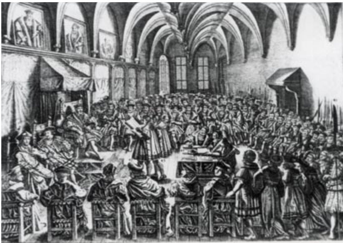
Die Überreichung der Augsburger Konfession auf dem Reichstag. Kupferstich von 1630.