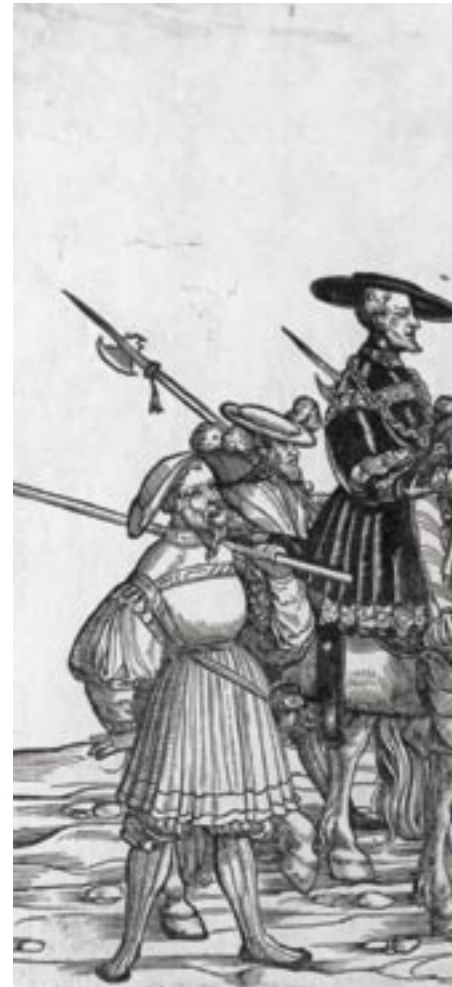
HERZOG ANTON-ULRICH-MUSEUM, BRAUNSCHWEIG

Seit ihrer Begründung hat die Jüngerer Reihe zwischen zwei Konzeptionen geschwankt: Dokumentation der Reichsgeschichte oder Beschränkung auf die Reichstage. Beide Konzeptionen haben ihren Niederschlag in Bänden der Reihe gefunden. Mit der Installierung der Wiener Arbeitsstelle wurde definitiv die Eingrenzung der Edition auf die Reichstage selbst festgelegt. Lediglich Abschiede vorbereitender oder begleitender Sondertagungen werden seither mitberücksichtigt. An den bisherigen Arbeitsmethoden wurde zunächst festgehalten, bis unter dem Druck des auf 2005 festgelegten Laufzeitendes für das Vorhaben (mit einer Auslauffinanzierung bis Ende 2006) hier beträchtliche Änderungen vorgenommen werden mussten, um die Zeit optimal zu nutzen und die Bandfolge zu beschleunigen. Zu diesem Zweck wurde die Zahl der für die Materialgewinnung besuchten Archive von bisher etwa 45 auf diejenigen 15 reduziert, die nach aller Erfahrung besonderen Ertrag versprechen: die kurfürstlichen sowie wichtige fürstliche und städtische Archive. Den Grundstock des Materials liefern ohnehin immer die Bestände in Wien, die sowohl die habsburgisch-kaiserliche Überlieferung wie auch das Mainzer Reichserzkanzlerarchiv umfassen. Zurückgenommen wurde auch die Dokumentation der Überlieferungshäufigkeit eines