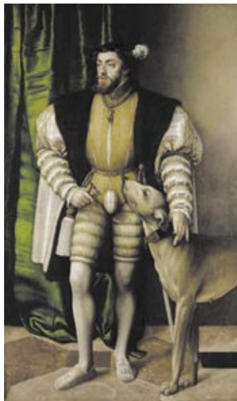
Kaiser Karl V., Ölgemälde von Jakob Seisenegger, 1532.

Seit Beginn des 16. Jahrhunderts war der Reichstag als Ständeversammlung eine feste Größe im Verfassungsgefüge des Heiligen Römischen Reiches Deutscher Nation. Er tagte nach Bedarf, nicht periodisch, und wurde vom Kaiser einberufen, der aber nicht ohne Wissen und Willen der Kurfürsten handeln sollte. Teilnahmeberechtigt waren etwa 350 einzelstaatliche Autoritäten, vom großen und einflussreichen Territorialfürsten bis zur kleinen Reichsstadt oder Reichsabtei. Sie waren auf dem Reichstag in drei Kurien (oder Kollegien) organisiert: die Kurfürsten; die geistlichen und weltlichen Fürsten, Grafen und Herren; die Reichsstädte. Die Verhandlungsprozeduren waren umständlich: Jede Kurie tagte für sich und tauschte mit den anderen schriftlich ihre Vorstellungen aus, bis im Hin und Her der Entwürfe ein Text zustande kam, auf den sich wenigstens die beiden oberen Kurien mit dem Kaiser oder seinem Vertreter einigten. In interkurialen Ausschüssen, in denen kurfürstliche Räte mit Delegierten der anderen Kurien zusammen berieten, konnte die Entscheidungsfindung beschleunigt werden.