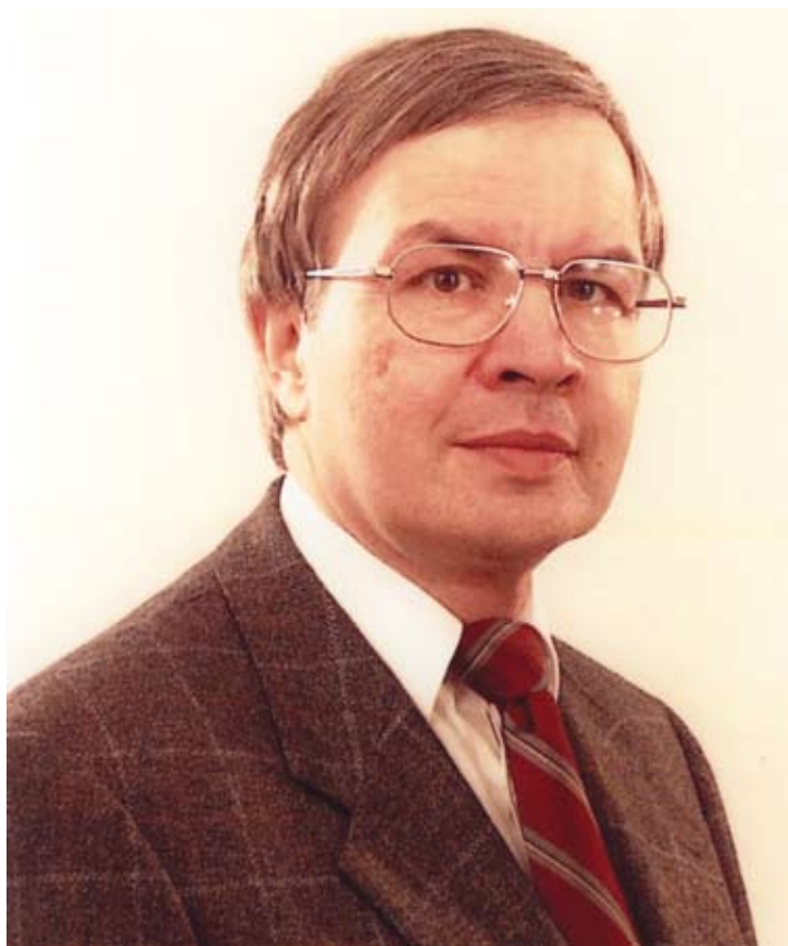
Nobelpreisträger Theodor W. Hänsch, seit 1991 ordentliches Mitglied der Bayerischen Akademie der Wissenschaften.

THEODOR W. HÄNSCH, SEIT 1991 ORDENTLICHES MITGLIED DER BAYERISCHEN AKADEMIE DER WISSENSCHAFTEN, ERHIELT FÜR SEINE BAHNBRECHENDEN ARBEITEN ZUR FREQUENZMESSUNG VON LASERLICHT DEN PHYSIK-NOBELPREIS 2005.