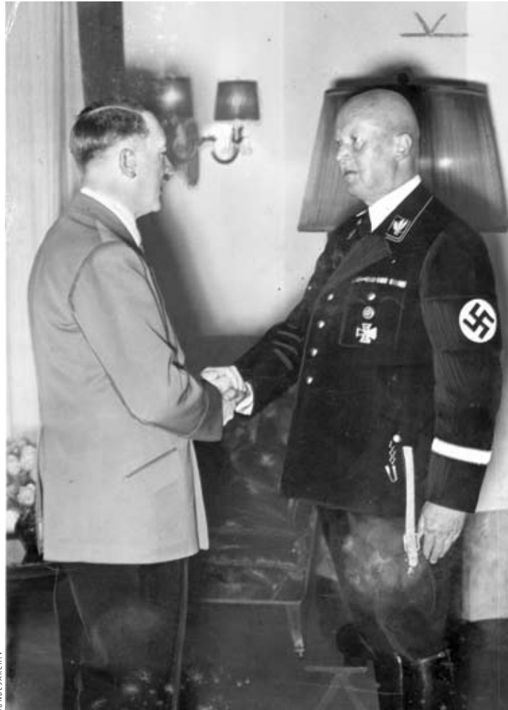
Hitler gratuliert Staatssekretär Lammers zum 60. Geburtstag am 27.5.1939.

Die Serie Regierung Hitler startete mit einem Band, der von der „Machtergreifung“ im Januar 1933 bis zu Hindenburgs Tod im August 1934 führt. Der zweite Band reicht bis zum Jahresende 1935. Mit dem dritten Band, der das Jahr 1936 umfasst, ging die Edition zum Prinzip der Jahressbände über. Druckfrisch liegt nun der neue Band vor: Die Regierung Hitler Band IV: 1937 . Wie die Bearbeitung der beiden vorherigen Bände, die 1999 und 2002