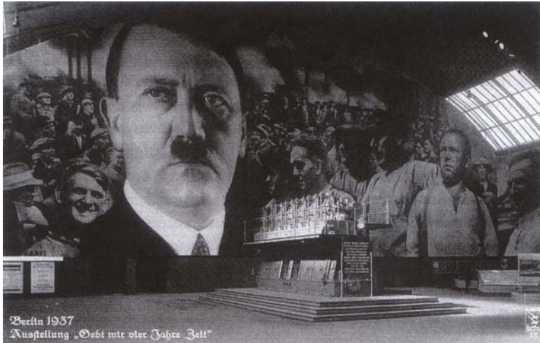
Abb. 9: Größtes Bild Hitlers (18 m hoch) anlässlich der Ausstellung „Gebt mir vier Jahre Zeit“.

diesem Tag fuhr Hitler um Mitternacht durch das Siegestor in München „über die von Feuerpylonen erhellte Ludwigstraße zur Feldherrnhalle, die mit blutrotem Tuch ausgeschlagen war“, um dort die Toten zu ehren. Der 9. November wurde zum „weihevollsten Tag“, die Feldherrnhalle zum „heiligsten Ort“ des braunen Kult. Wie es Hans Günter Hockerts ausgedrückt hat: „An keinem anderen Feiertag traten die Züge einer ‚politischen Religion‘ so deutlich hervor: Der 9. November wurde zum Angelpunkt