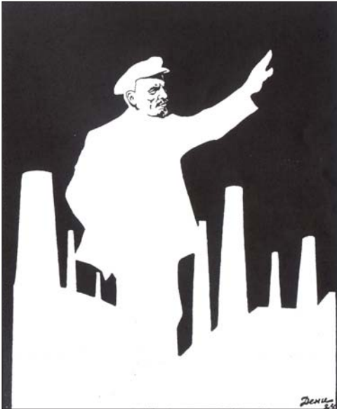
Abb. 1: Lenin als Redner vor der Silhouette der Fabrikschloten

Niemand hätte wohl im „langen 19. Jahrhundert“, zwischen der Französischen Revolution und dem Ende des Ersten Weltkriegs, damit gerechnet, dass das 20. Jahrhundert einen ebenso universellen wie militanten Herrscher- und Führerkult hervorbringen würde. Überdimensionale Parteiveranstaltungen mit Massenaufmärschen, Riesenbauten, Lichtdomen, die Allgegenwart der Mächtigen, Bilder des „Großen Bruders“ auf Straßen