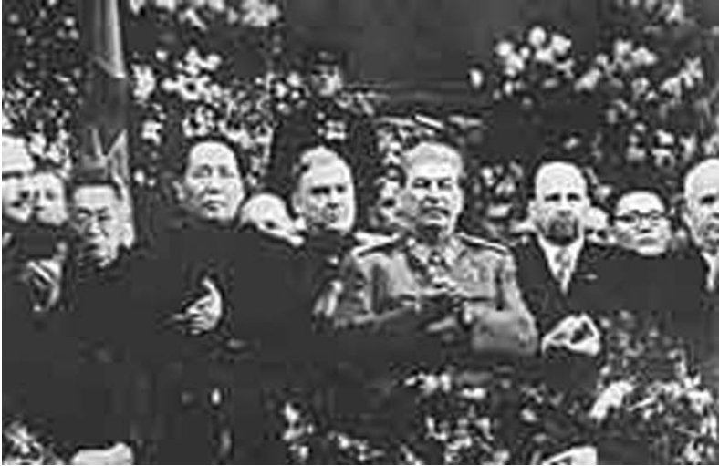
Abb. 12: Mao, Stalin und Ulbricht

tung. Um Mao entstand ein regelrechter Sonnenkult, er wurde im Osten – aber auch in den Kulturrevolutionen des Westens! – in Sprechchören, Prozessionen, Revolutionsopern, im ständigen Rezitieren von Sprüchen und Sentenzen verherrlicht. Er war nach einem ständig wiederholten Wort die „rote rote Sonne in unseren Herzen“. Eine ähnliche kulturelle Monokultur wie im China der Mao-Zeit hat es nicht einmal in der Sowjetunion zu Zeiten Stalins gegeben. Sie steigerte sich ein weiteres Mal in der Kul-