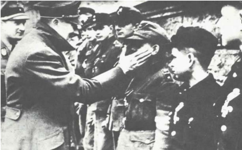
Abb. 8: Eine der letzten Aufnahmen von Adolf Hitler: An seinem Geburtstag (20. April 1945) zeichnet er Mitglieder der Berliner Hitler-Jugend aus, die zum Ende des Zweiten Weltkrieges in Volkssturmeinheiten zusammengefasst wurden