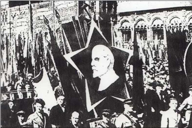
Abb. 2: Mai-Demonstration in Moskau mit Lenin-Ikone

Der Erste Weltkrieg hatte die liberale Kultur Europas aus ihren Verankerungen gerissen. Im Chaos von Krieg und Nachkriegszeit wurden viele Menschen anfällig für neue Heilslehren. Der „Frühling der Heilbringer“ war ein gesamteuropäisches Phänomen – nach 1917/18, nach 1922 und erst recht nach 1933. Die Zeit war bewegt von Erlösungsstimmungen; politische Führer wurden zu messianischen Figuren, sie zogen Bewunderung und Verehrung auf sich. Bilder der Führer standen im Mittelpunkt politischer Liturgien, sie wurden bei Märschen mitgeführt, bei Gedenkfeiern feierlich erhöht und allen sichtbar gemacht. Aber sie drangen auch in häuslichen Formaten in den Alltag ein. Im Russland der Revolution