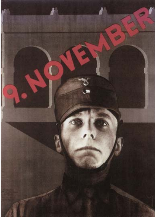
Abb. 11: Propagandaplakat um 1939

Auf eine vorläufig letzte Vergöttlichung politischer Herrscher im 20. Jahrhundert stoßen wir im China des „Großen Sprungs“, im Maoismus. Wiederum verbinden sich dabei Elemente von Religion und Politik, von „heiliger Lehre“ und systematischer, alle Volksschichten durchdringender Katechese. Die Führer des neuen China verstehen sich als Werkzeuge