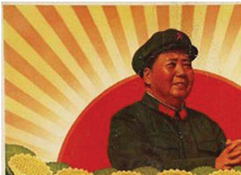
Abb. 14: „Sonnenbild“ Maos

Dass die Diktaturen ein Ende hatten, dass die Denkmäler der Führer stürzten, ist tröstlich. Es darf freilich zu keiner falschen Sicherheit führen. Den Überlebenden der Katastrophen – und uns allen als Nachgeborenen – stellt sich die Frage, ob die totalitären Regime im 21. Jahrhundert end-