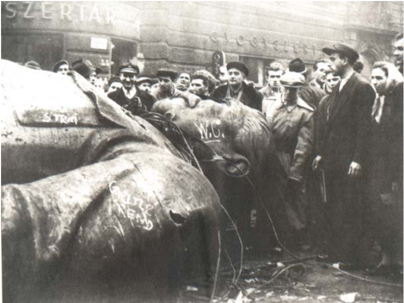
Abb. 4: Sturz der Stalin-Statue im Ungarnaufstand 1956

Umso tiefer war dann – nach Stalins Tod 1953 und einer dreijährigen „Schamfrist“ – der Fall. 1956 rechnete Nikita Chruschtschow auf dem XX. Parteitag der KPDSU in einer Geheimrede mit Stalin ab. Er hielt sie erst nach dem Ende der normalen Tagesordnung unter größten Sicher-heitsvorkehrungen vor dem inzwischen neugewählten ZK (die Delegier-ten wurden eigens zurückgerufen). Es war der erste systematische, von langer Hand geplante Denkmalsturz eines Diktators im 20. Jahrhundert, ausgelöst durch einen seiner Nachfolger, der die alten Stalinanhänger im ZK ausgeschaltet und sich der Unterstützung neuer Führungsgruppen versichert hatte. Stalins postumer Sturz war etwas anderes als das Ende Mussolinis und Hitlers: beide waren im Chaos des Weltkriegsendes unter-gegangen, von Partisanen erschlagen der eine, von eigener Hand getötet der andere; sie hatten kein ruhmvolles Nachleben wie Stalin, und was an