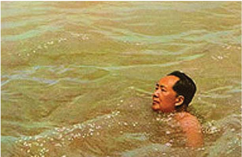
Abb. 13: Mao durchquert den Jangtse während des langen Marsches

aber sie werden nach wie vor gelesen; was seine Verbrechen – oder wie man beschwichtigend sagt: seine Fehler – angeht, so schiebt man sie auf die „Viererbande“, auf falsche Berater, auf sein Alter und seine Krankheit. Es ist ein leiser, ein unmerklicher Denkmalsturz. Mao Tse-tungs Ideen sind nicht mehr „die Sonne, die ewig scheint“; die fünfzehnfarbigen Mao-Bilder aus Leinen, die im ganzen Land verbreitet waren, werden nicht mehr gewebt – und wer sich der heutigen politischen Führung entgegenstellt, dem drohen zwar Prozesse und Strafen, doch er muss nicht mehr, wie zu Zeiten der Kulturrevolution, öffentlich unter einem Schandhut beichten und Besserung geloben.